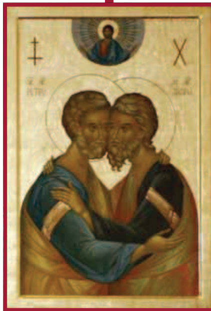
Sfinții Apostoli Petru și Andrei - icoană pe lemn, Centrul „Petru și Andrei”, București

Simon, în ciuda fragilității sale omenești, a fost numit de Isus Petru („piatră”), stâncă pe care va fi zidită Biserica. Lui îi vor fi încredințate „cheile” Împărăției cerurilor (cf. Mt 16,18). Drumul său de apostol îl va conduce de la Ierusalim