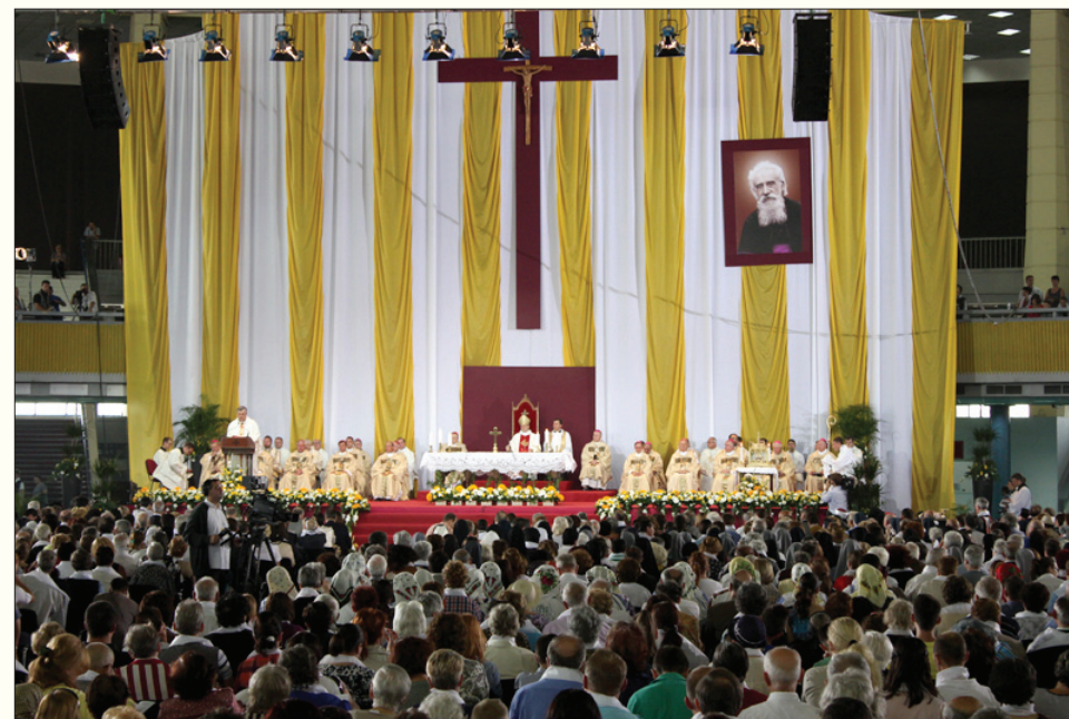
Instantaneu din timpul celebrării beatificării Monseniorului Vladimir Ghika la București, în ziua 31 august 2013.

În Catedrala Sf. Iosif, din București, pe durata întregii zile, va fi expusă spre venerare relicva Fericitului Vladimir Ghika.