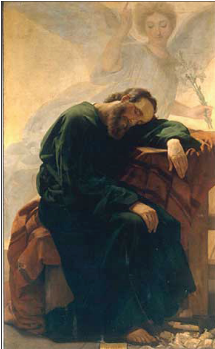
Visul Sfântului Iosif, de Antonio Ciseri Sec. XIX, ulei pe pânză, Florența