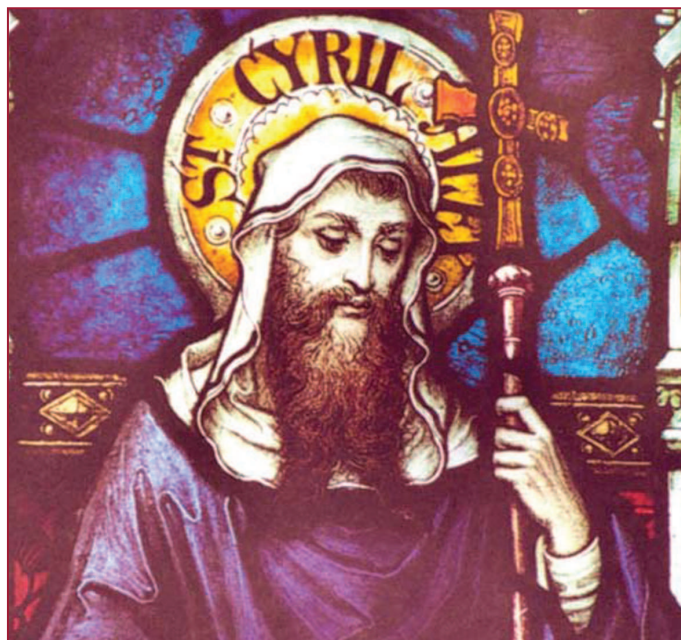
Sfântul Ciril din Alexandria

Mai întâi, simbolul de la Niceea se preta la răstălmăciri, fiindcă era formulat cu ajutorul unor noțiuni de origine filosofică: substanță sau natură, ori ființă, persoană sau