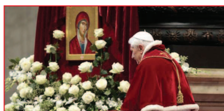
Papa alături de icoana Sfintei Fecioare Maria de la Filerimos, patroana Ordinului de Malta