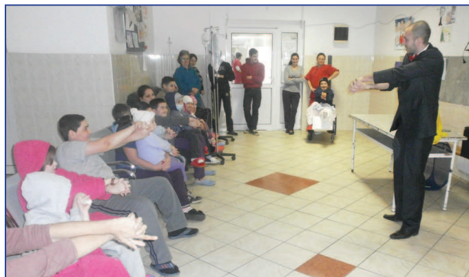
Copii la spital - ora de joacă

Societatea Internațională de Oncologie Pediatrică și Confederația Internațională a Organizațiilor de Părinți cu Copii bolnavi de Cancer fac apel la guvernele lumii să își intensifice eforturile în lupta contra cancerului la copii prin întărirea sistemelor de îngrijire a copiilor bolnavi de cancer în țările lor.