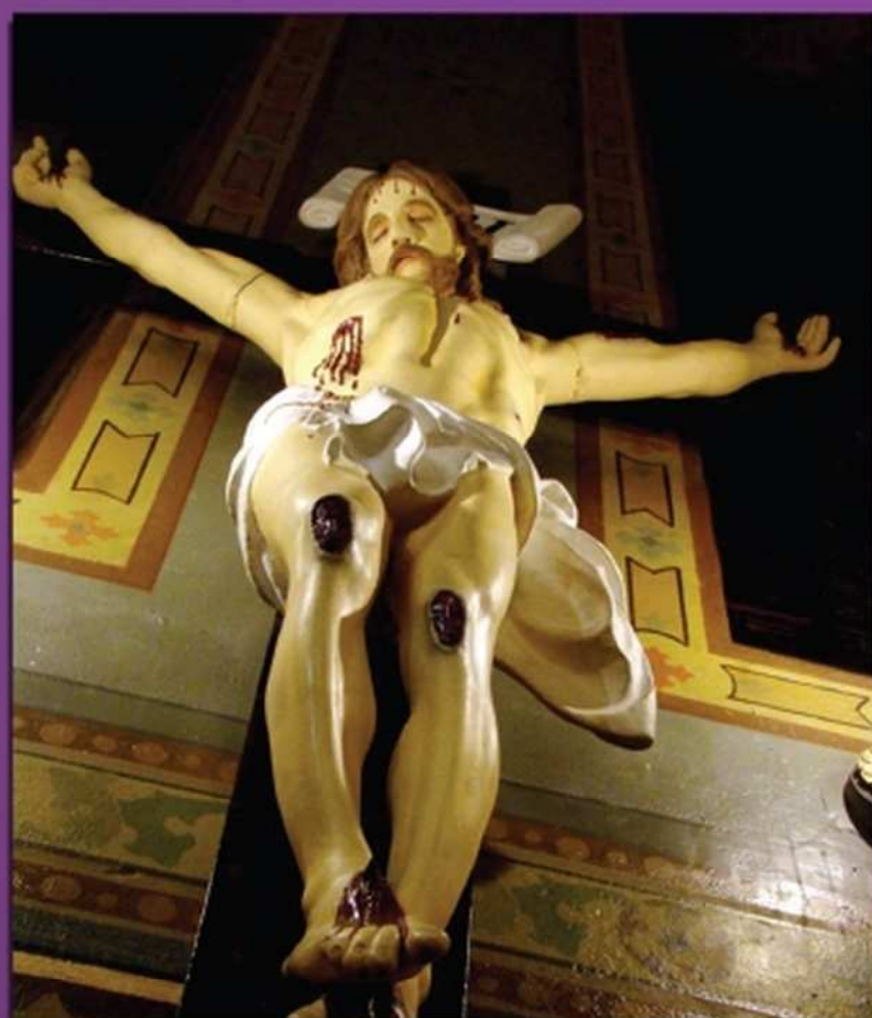
MIERCUREA CENUȘII CATEDRALA SF. IOSIF BUCUREȘTI, 13 FEBRUARIE 2013