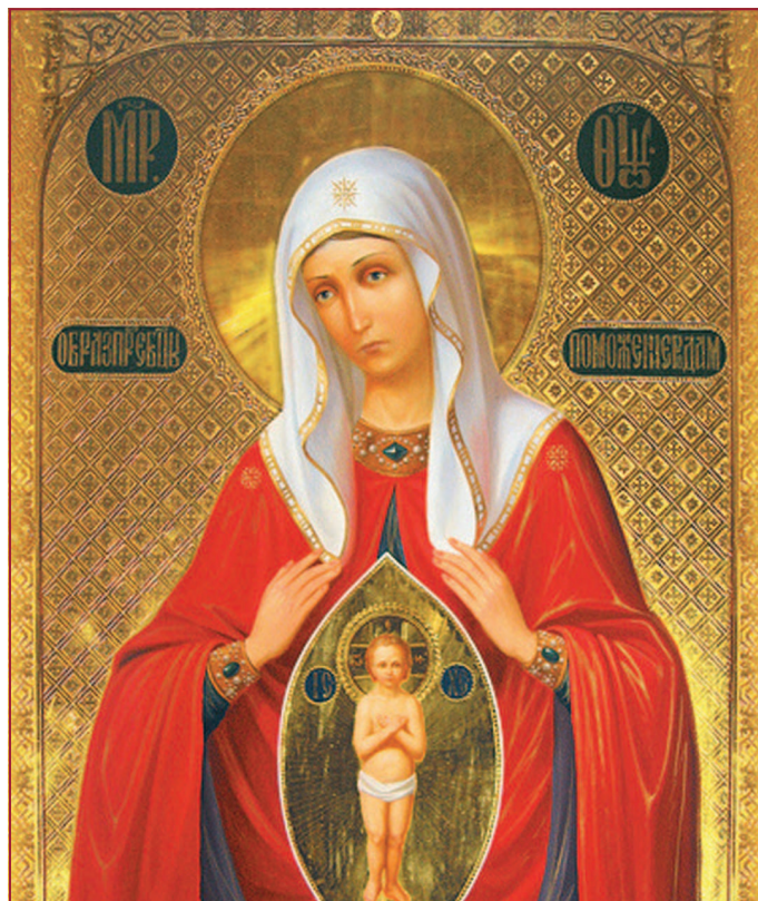
Sfânta Fecioară Maria, Maica lui Dumnezeu

Revenirea la aceste chestiuni dogmatice și istorice este importantă pentru noi, astăzi, fiindcă ne ajută să înțelegem