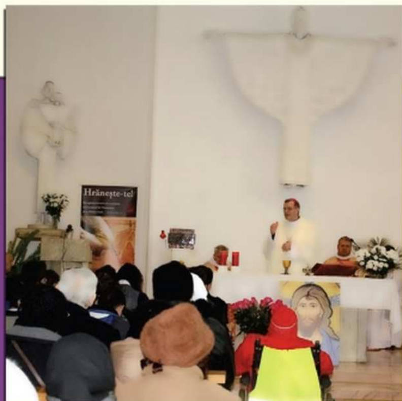
ZIUA MONDIALĂ A BOLNAVULUI BISERICA „MAICA ÎNDURERĂTĂ” BUCUREȘTI, 11 FEBRUARIE 2013