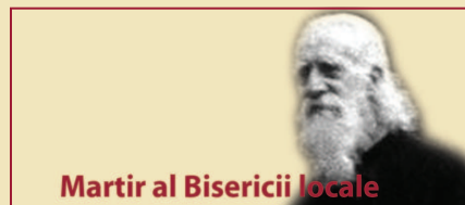
Martir al Bisericii locale