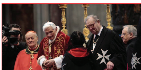
Papa binecuvântează copii din Ordinul de Malta în prezența Marelui Maestru al Ordinului