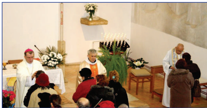
Liturghia solemnă celebrată în biserica Maica Îndurerată, București

Ziua Mondială a Bolnavului, așa cum explică Papa Benedict al XVI-lea în mesajul său, „este pentru bolnavi,