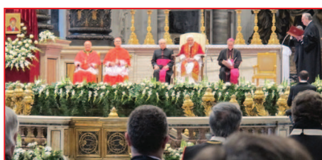
9 februarie 2013, Bazilica Sfântul Petru - Sfântul Părinte ascultă discursul Marelui Maestru